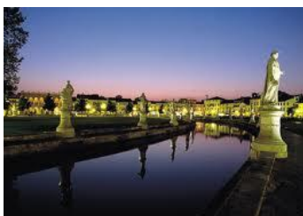
Prato della Valle

Arrivo all'Aeroporto di Venezia, trasferimento a Padova con pullman GranTurismo. Incontro con la guida.