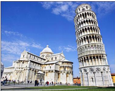
Pisa: Piazza dei Miracoli