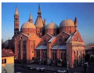
Basilica del Santo – S. Antonio da Padova