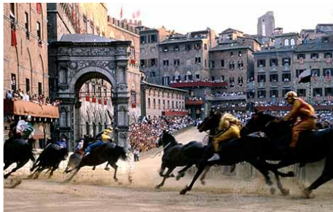
Siena: Il Palio

Colazione in hotel. In mattinata trasferimento a Pisa e incontro con la guida.